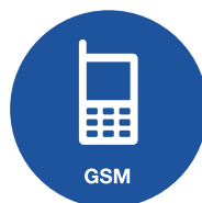
SMS a volání